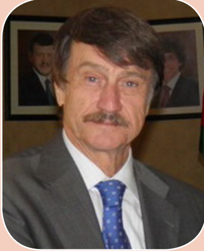
بقلم الدكتور حيدر رشيد

أما أزمة جائحة كورونا فهي أزمة صحية تنوعت التفسيرات في أسبابها ما بين كونها صناعة بشرية تم إعدادها في المختبرات، وما بين أنها وباء أو جائحة ليس للإنسان وأطماعه علاقة بظهورها، على أن الشيء الثابت بعد حوالي العام من بداية الجائحة هو أن ما روج له الرئيس المعزول (ترامب) بأن هذه الجائحة هي صناعة صينية تبين عدم صحته بشكل قاطع بدليل أن أقل الإصابات في