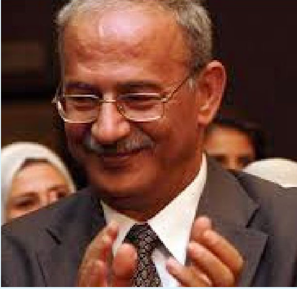
بقلم الباحث في التأمينات الاجتماعية الدكتور محمد خالد الزعبي