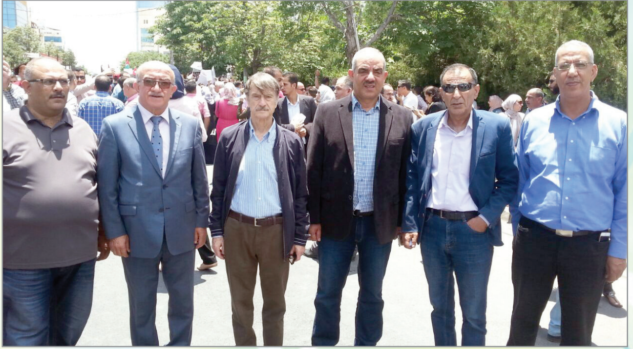
أعضاء الهيئة الادارية بعد المشاركة في الاضراب

بهذه الفعاليات وتوسيع قاعدة الدعم لها، فإجراءات الحكومة ومشاريعها وصلت الى جيوبهم وأوصلت ظهورهم الى الحائط لتشريعاتها، وفي حال عدم التصدي لهذه الإجراءات فإن الأمور لن تقف عند هذا الحد، وستستمر الإجراءات الحكومية التي تستند الى الإملاءات وتستند الى الأرقام بدون النظر الى النتائج الاجتماعية والاقتصادية على المواطنين .