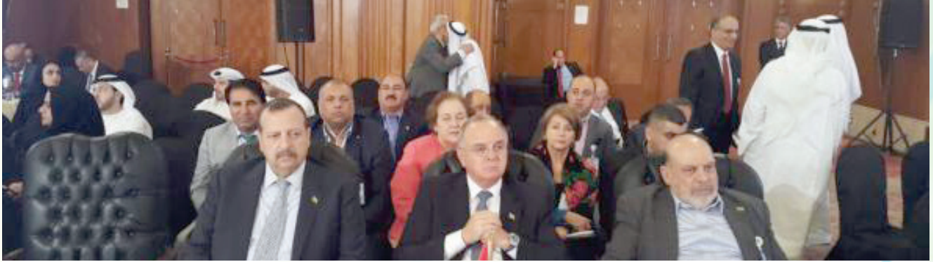
الوفد الاردني في المؤتمر

البند الخامس: تطبيق اتفاقيات وتوصيات العمل العربية. البند السادس: مذكرة المدير العام لمكتب العمل العربي حول الدورة (١٠٧) لمؤتمر العمل الدولي الذي سيعقد في مدينة جنيف خلال شهر حزيران ٢٠١٨.