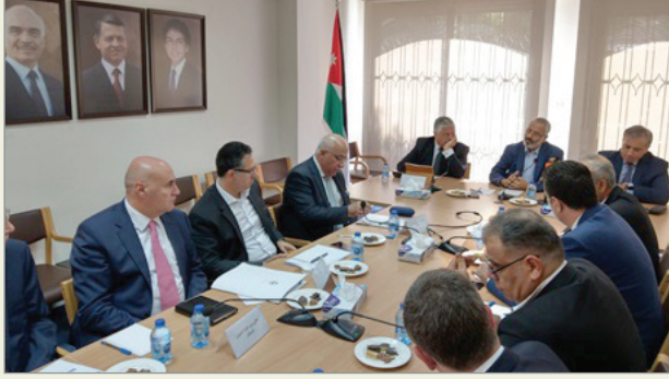
اجتماع المجلس الاقتصادي مع الفريق الوزاري

«مشروع القانون لا يحقق الاستقرار وهو استمرار للتعديلات السابقة التي تهدف إلى زيادة الجباية لسد العجز في الموازنة»